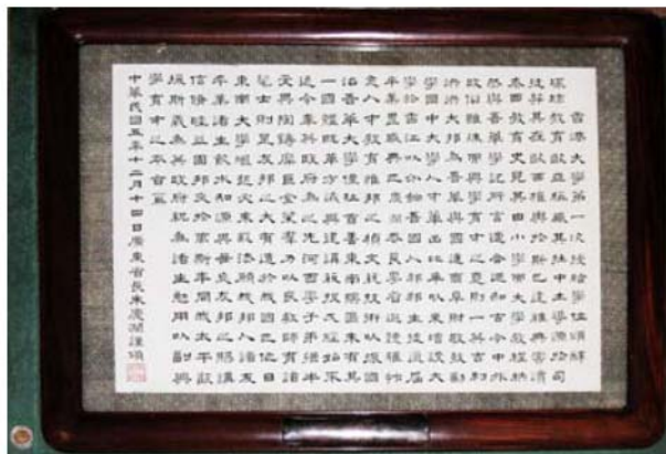
《圖一：香港大學第一次授給學位頌辭》

本頌辭為著名先烈，時任廣東省長的朱慶瀾於民國五年 [1916] 12月撰書贈予港大的。正文以 54 長短句合成，內容以「興學育才」為主旨及作起結，大致可分為三段：首述古今中外興學育才的本旨均相同，中段讚譽英國在香港設置大學；為我國南方興學之先河，末後勉勵畢業諸生要「飲水知源」，更願兩國信睦邦交，長治太平。全文自然流暢，言簡義正，雍容大度，是一篇難得的頌書。朱氏以一介武夫而以正氣擅書傳世，所題聯語、扁額多作行書或行草，如此工麗頌辭的前期作品更是難得一見。他曾於同月題贈予港商劉鑄伯的『錫類推仁』及『鹿車遺愛』二匾額，未知華商會可曾保留？本校經戰亂日治尚妥存此文物，馮平山圖書館職員功不可抹。