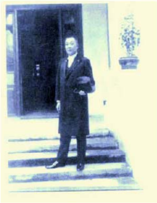
圖四。 朱慶瀾之廣東 省長照片

Congratulatory Message to the University of Hong Kong from H.E. Chu Ching-lam, Civil Governor of Kwang Tung on the occasion of the First Congregation for Conferring Degrees, December 14 th 1916